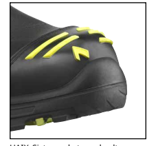
HAIX®Sistema de tapa de alta durabilidad