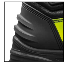
HAIX®Gato de arranque