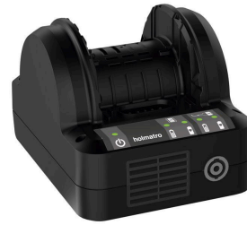
Cargador de batería PBCH6 (AC-KR)

( https://www.holmatro.com/es/rescate/cargador-de-bateria-pbch3-dc )