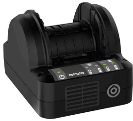
Cargador de batería PBCH2 (AC-US)

( https://www.holmatro.com/es/rescate/cargador-de-bateria-pbch5-ac-uk )