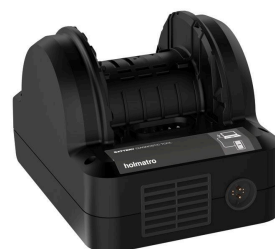
Herramienta de diagnósticos de la batería PBBD1