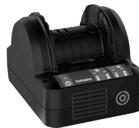
Cargador de batería PBCH4 (AC-JP)

( https://www.holmatro.com/es/rescate/cargador-de-bateria-pbch1-ac-eu )