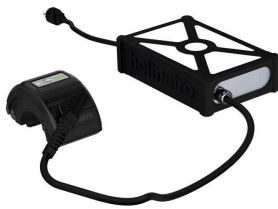
Conector para red eléctrica PMC6 (KR)

( https://www.holmatro.com/es/rescate/conector-para-red-electrica-pmc2-us )