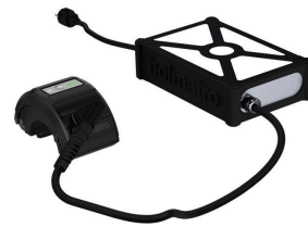
Conector para red eléctrica PMC8 (IN/ZA)

( https://www.holmatro.com/es/rescate/conector-para-red-electrica-pmc6-kr )