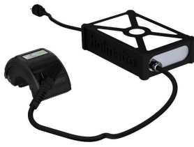
Conector para red eléctrica PMC1 (EU)

( https://www.holmatro.com/es/rescate/herramienta-de-diagnosticos-de-la-bateria-pbdt1 )